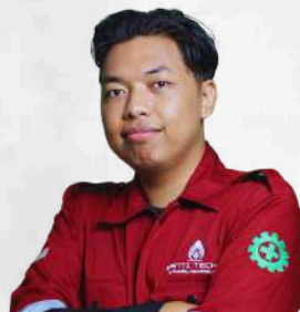
KRESNOWATI DIGITAL MARKETING